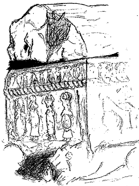
« Pleureuses représentées sur le sarcophage d'Ahiram de Byblos »

tonsure. On ne rompra pas le pain à qui est dans le deuil pour le réconforter après un décès » (Jr 16,6-7). Les textes bibliques montrent l'importance de la lamentation, qui était avant tout le domaine des femmes (pleureuses professionnelles) 14 . Le sarcophage du roi Ahiram de Byblos (fin du II e millénaire avant notre ère) reproduit des femmes en pleine activité de deuil. Leurs gestes correspondent à ce qui est décrit dans la Bible : « Soyez dans l'effroi, vous qui êtes satisfaites ! Tremblez, vous qui êtes confiantes ! Déshabillez-vous, dénudez-vous et mettez un pagne sur vos reins ! On se lamente, en se frappant la poitrine... » (És 32,11-12). De nombreux textes évoquent l'activité des pleureuses : « Ainsi parle Yhwh Sebaot : faites venir les pleureuses, qu'elles se hâtent, que sur nous s'élève leur plainte... » (És 32,11) ; Qo 12,20 mentionne les pleureuses professionnelles rôdant dans la rue.